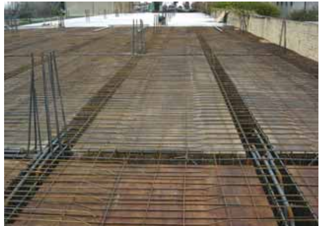
Llenado de la losa.