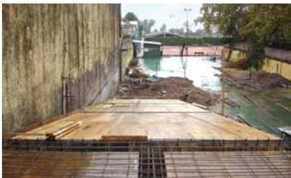
Preparación de la rampa.