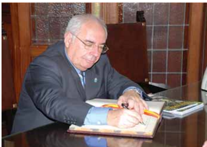
El Presidente Areces, firmando el "Libro de Oro" de la Institución.