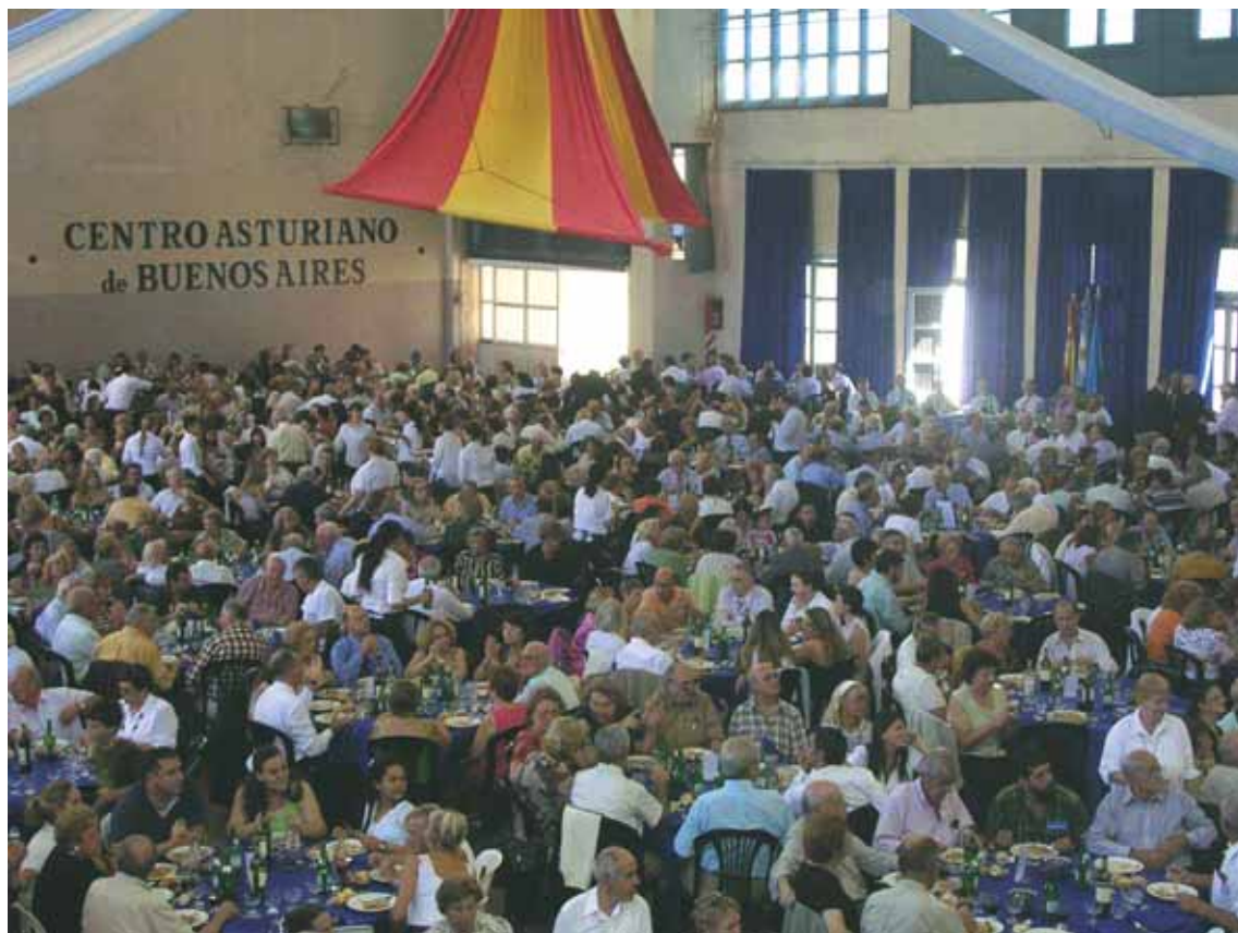
El Microestadio Príncipe de Asturias donde se disfrutó de la Gran Fabada Aniversario, a la cual asistieron más de 1.000 comensales, con gran entusiasmo.