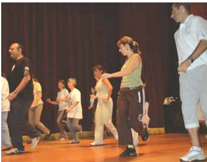
Los participantes del Curso en pleno ensayo.

Se trató de un curso intensivo, durante el cual aprendimos, no solo pasos y coreografías, sino también el origen de los bailes y danzas, los módulos que los componen, sus zonas de pertenencia, las diferencias folklóricas entre las distintas regiones del territorio asturiano, y el contexto socio cultural en el cual se desarrollaban. El desarrollo simultáneo del curso de gaita asturiana dictado por Flavio Benito, permitió una interacción sumamente enriquecedora acerca de la relación y dependencia de los músicos y bailarines.