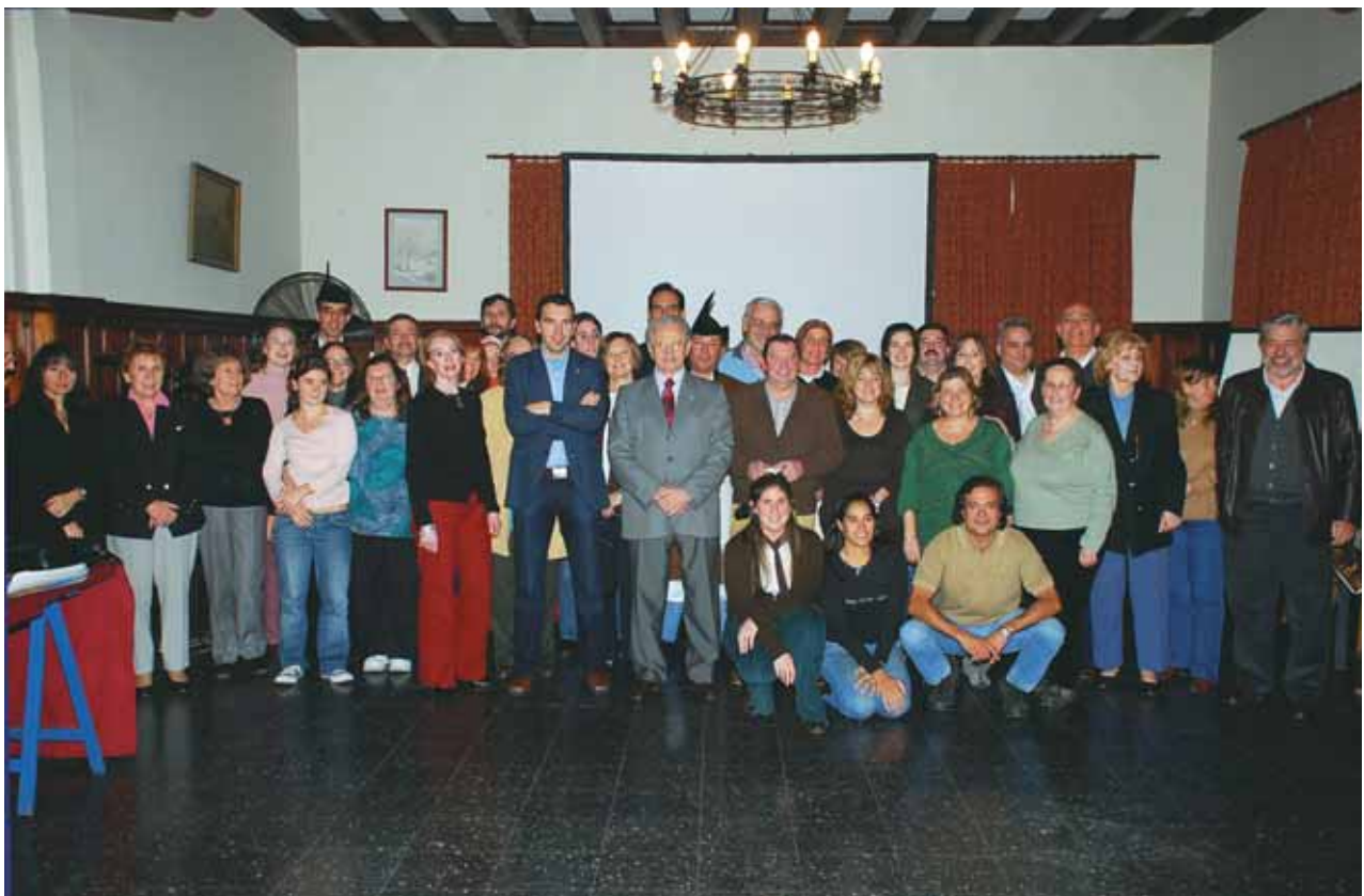
El grupo que asistió con gran interés a la segunda edición del "Curso de la Llingua Asturiana"