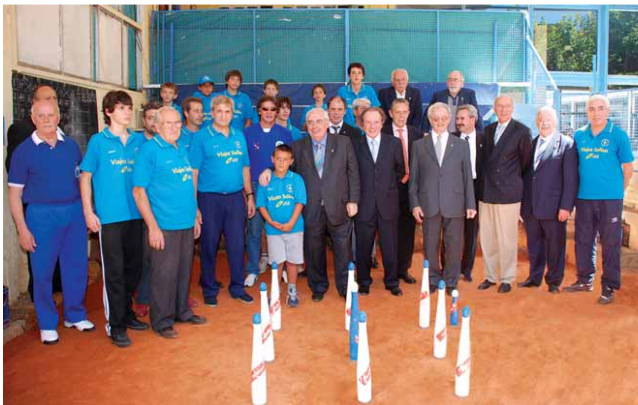
Las autoridades presentes acompañaron a los jugadores, siguiendo los partidos con entusiasmo.