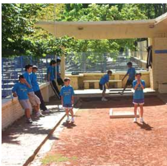
También con para orgullo de la Institución, participaron jóvenes y niños.