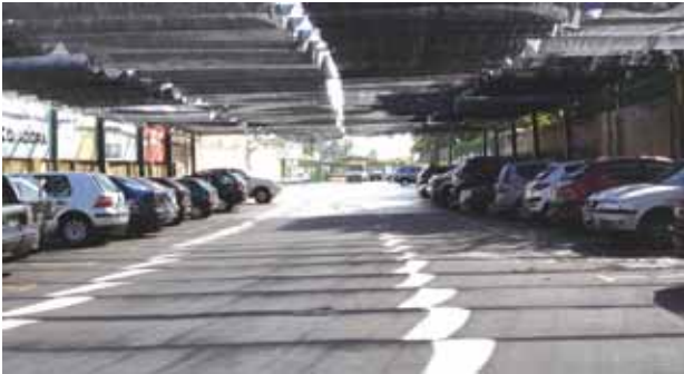
El estacionamiento antes de marzo.