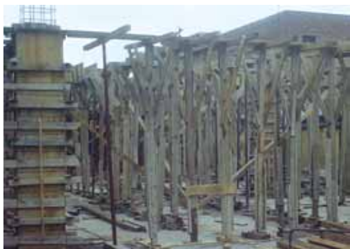
Armado del encofrado.