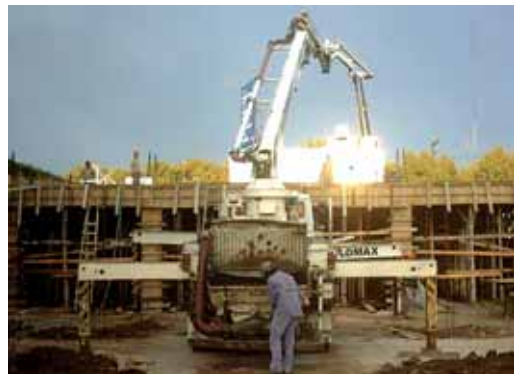
Llenado del encofrado.