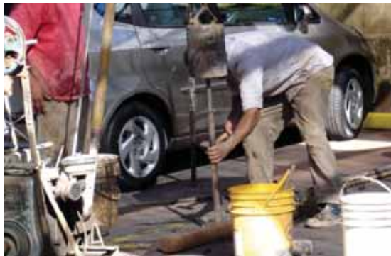
Tareas de estudio de suelo.