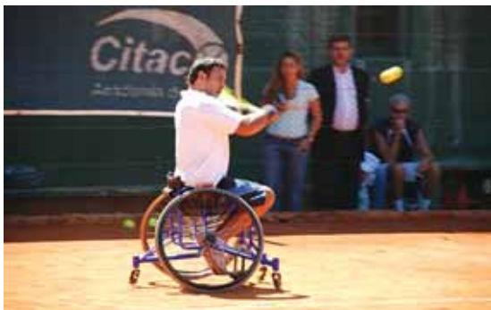
Exhibición de Tenis Adaptado con la participación de notables Atletas.