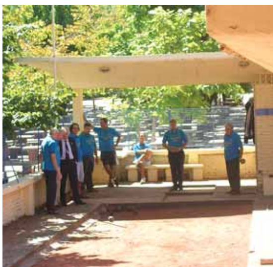
El Torneo fue seguido con mucho interés por jugadores y demás asistentes.