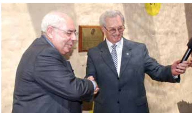
El Presidente Areces, descubre una placa en su honor colocada en el estacionamiento.