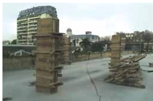
Comenzando la segunda etapa.