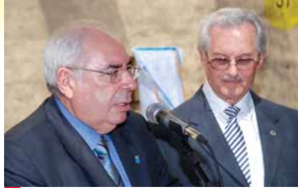
El Pte. Areces habla en la colocación de la placa que dio inicio de obras.

La Honorable Junta Directiva, por mi intermedio, agradece el esfuerzo y la buena voluntad, tanto del Principado de Asturias, como el de todos sus asociados, sabiendo que la construcción de este gran sueño de muchos, ha dejado de ser un gran desafío, para convertirse en una gran obra real, que quedará como legado para el Centro Asturiano de Buenos Aires, y de todos sus asociados.